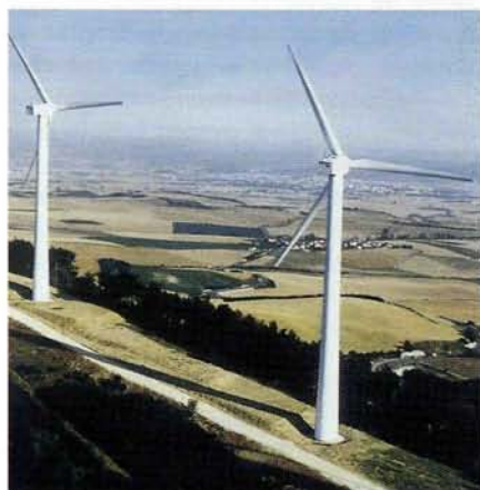
Parc d'éoliennes près de Pampelune (Navarre) en Espagne

Le développement des sources d'énergie renouvelables est l'un des objectifs de la politique énergétique de la Communauté européenne auquel la BEI apporte son concours en finançant, par des prêts à long terme, des projets économiquement justifiés. La Communauté ayant défini en 1980 les projets relatifs aux énergies renouvelables comme étant un moyen de réduire sa dépendance vis-à-vis des importations de pétrole, le Conseil des Ministres a déclaré en 1986 que la promotion des énergies renouvelables était un axe central de la politique énergétique de la Communauté. Mais en dépit de ces initiatives prises pendant les années 80, les sources d'énergie renouvelables ne satisfont encore à ce jour que moins de 6% de l'ensemble des besoins d'énergie primaire de l'Union européenne.