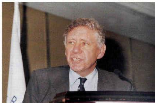
Sir Brian Unwin, Président de la BEI

Le thème du Forum doit être replacé dans un contexte global, a souligné Sir Brian Unwin, Président de la BEI, dans son discours liminaire. L'Union européenne devra parvenir à réduire ce niveau de chômage devenu intolérable, alors que sévit mondialement une crise financière et économique dont elle ne saurait sortir complètement indemne. Dans un environnement aussi instable, le rôle de l'Union économique et monétaire en tant que zone de stabilité dotée d'une monnaie