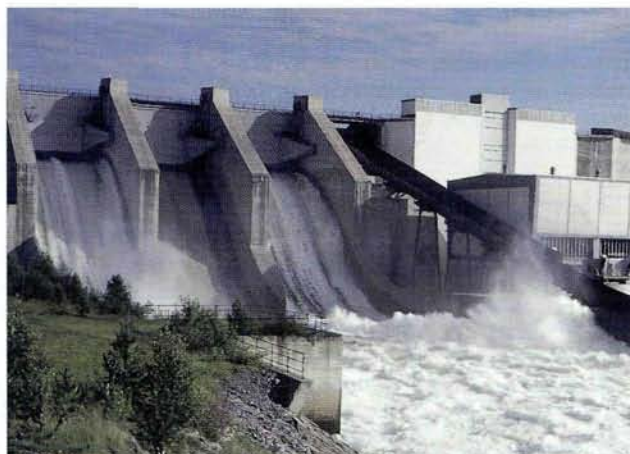
Centrale hydroélectrique dans le nord de la Suède

des projets d'éoliennes, d'hydroélectricité et de biomasse, et l'Allemagne 21%, toutes à l'appui d'installations éoliennes.