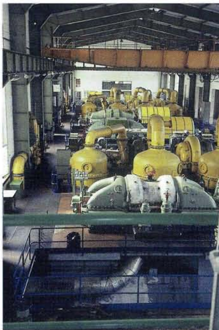
Centrale géothermique dans la région de Latéra (Latium), en Italie

sont à l'heure actuelle guère représentés dans le portefeuille de prêts de la Banque. On peut s'attendre à cet égard à des changements au cours des prochaines années, suite à l'attention renouvelée dont cet aspect fait l'objet dans les politiques énergétique et environnementale de la Commu-