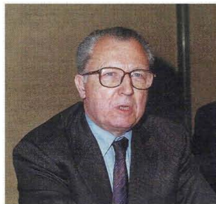
Jacques Delors, ancien Président de la Commission européenne

pectives en matière de financement d'investissements sur un marché intégré des capitaux a permis d'analyser les entraves à éliminer pour que les marchés boursiers européens deviennent de plus en plus une