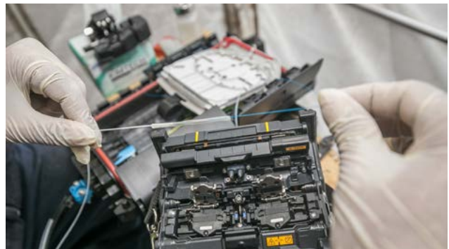
Ausbau des Open-Access-Glasfasernetzes von enet in Irland

Weitere Informationen auf unserer Website