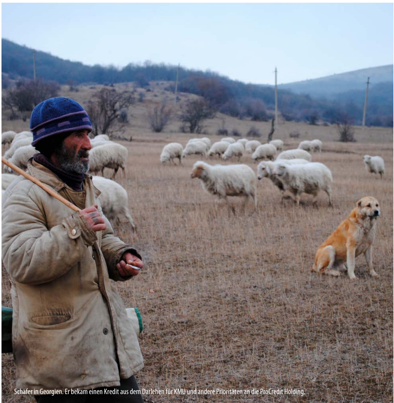
Schäfer in Georgien. Er bekam einen Kredit aus dem Darlehen für KMU und andere Prioritäten an die ProCredit Holding.

Weitere Informationen auf unserer Website