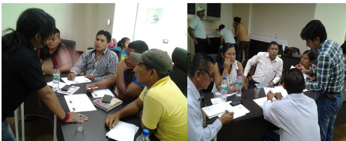
Fotos, taller de validación 29 de abril del 2016