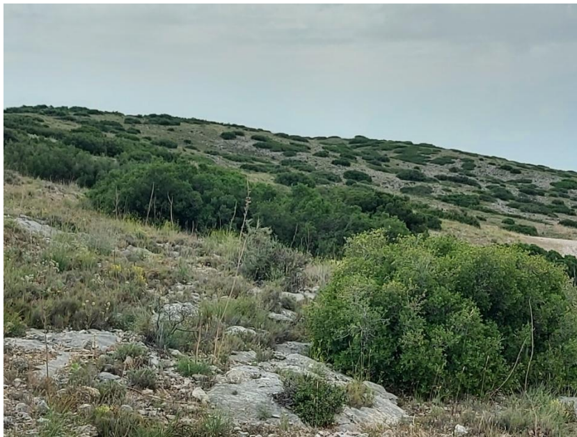
Figura. 6. Vegetación natural que se desarrolla en la zona en la que se proyecta la instalación del aerogenerador nº11