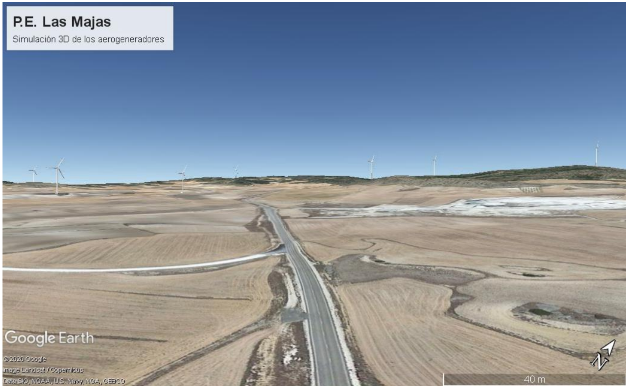
Figura. 2. Vista del parque eólico desde la carretera A-2305