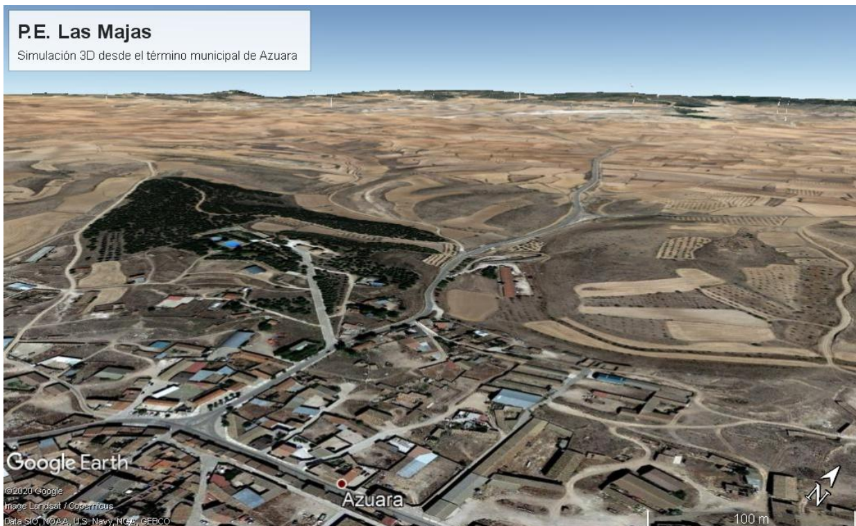
Figura. 3. Vista de los aerogeneradores desde el núcleo urbano de Azuara