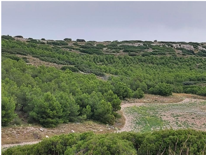
Figura. 7. Pinares de repoblación en cuyo entorno se implantará el aerogenerador nº12