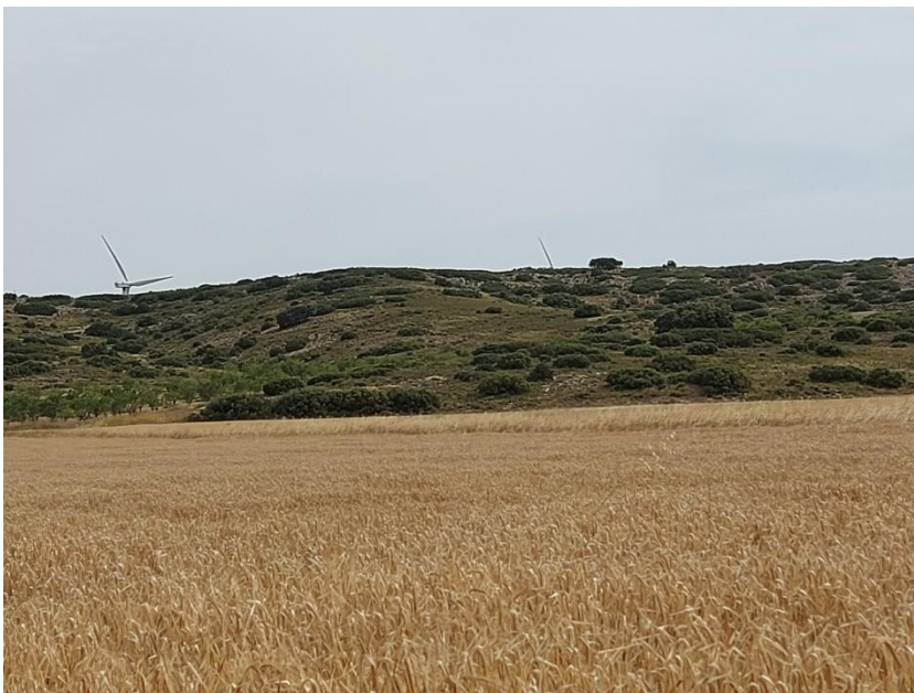
Figura. 4. Zona alomada cubierta por vegetación forestal en la que se implantará el aerogenerador nº7