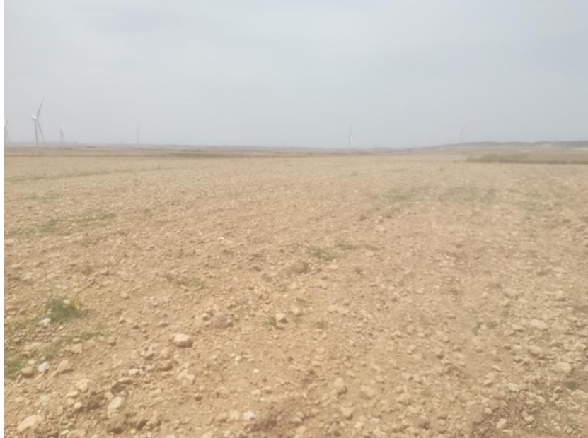
Figura. 1. Emplazamiento del apoyo n°1