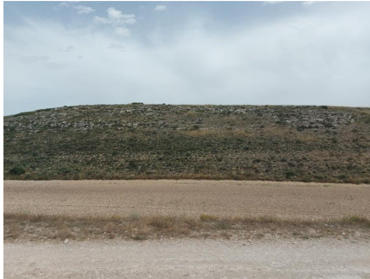
Figura. 5. En primer plano parcela agrícola sobre la que se implantará el aerogenerador nº8, al fondo zona alomada sobre la que se desarrolla vegetación natural