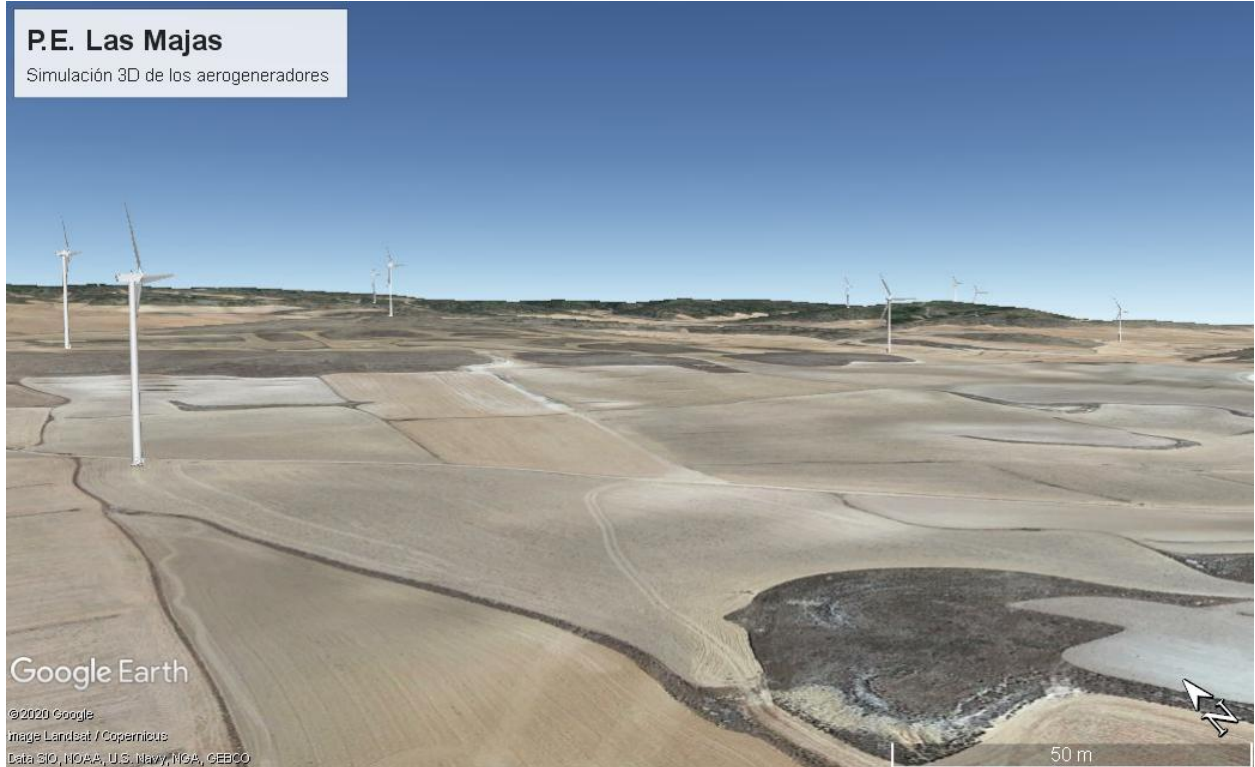
Figura. 1. Vista del parque eólico desde el aerogenerador AE01