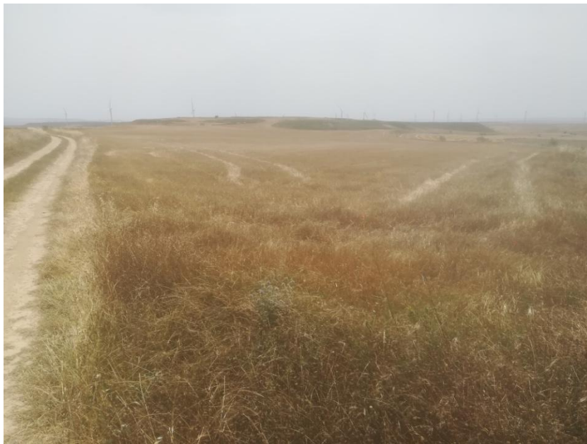
Figura. 2. Localización del aerogenerador n°3, la vegetación natural que se desarrolla en los márgenes de la parcela agrícola se corresponde con especies herbáceas