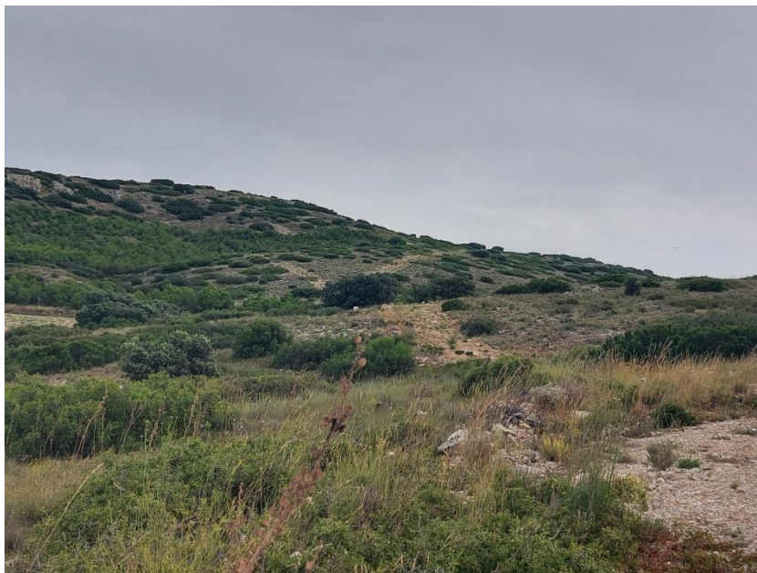
Figura. 8. Vegetación natural que se desarrolla en las laderas de la zona alomada en la que se proyecta la implantación del aerogenerador nº13