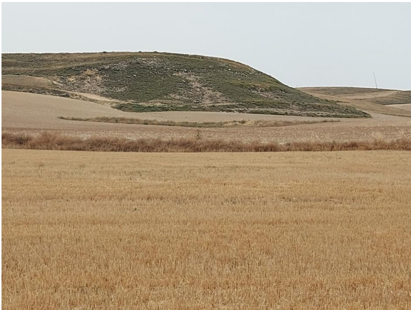
Figura. 3. Emplazamiento del aerogenerador nº5 sobre parcela agrícola, al fondo zona alomada colonizada por vegetación características del HIC 6220