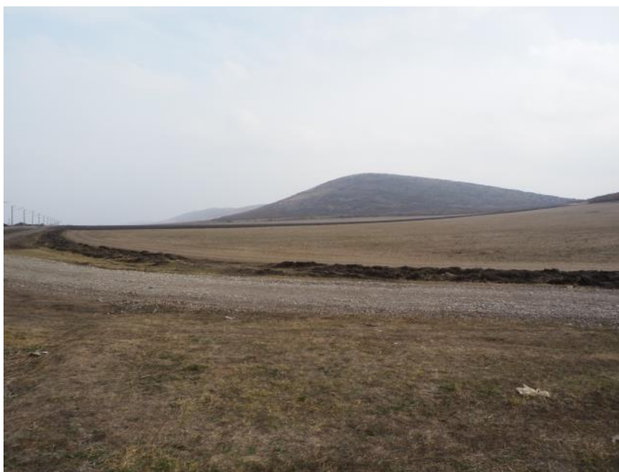
Фигура V.1.7-1: Общи вид на ЗЗ „Керменски възвишения“ и трасето на жп-линията.

Предмет на опазване в ЗЗ са два характерни пещеролюбиви вида – подковонос на Мехели ( Rhinolophus mehelyi ) и дългопръст нощник ( Myotis capaccinii ). Тяхното присъствие в екосистемите е свързано преди всичко с наличие на естествени подземни убежища и по-рядко с изкуствени такива (за подковоноса на Мехели). В района на Керменските възвишения отсъства подземно развит карст (Фиг. V.1.7-1), респективно естествени пещери, както и изкуствени убежища с подходящи микроклиматични условия за двата целеви вида прилепи.