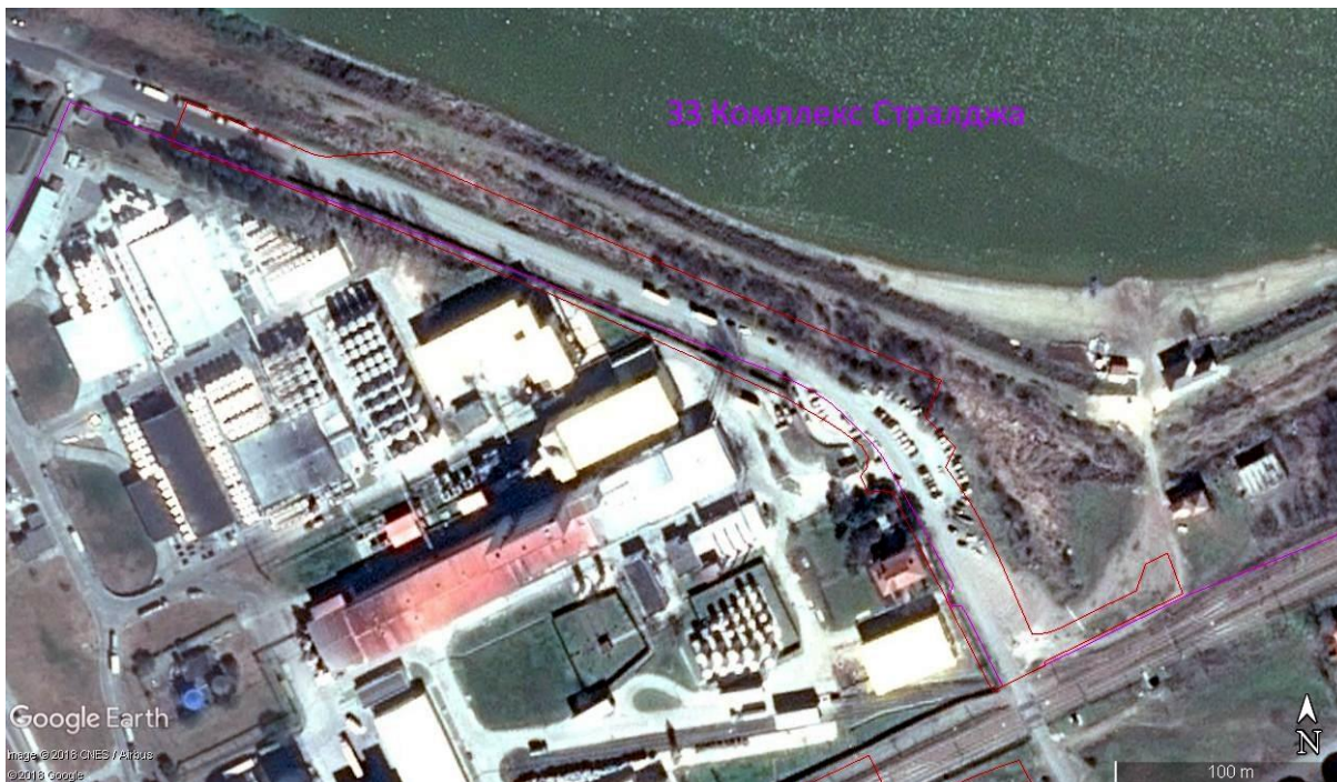
Фигура V.1.11-1: Характер на терена в обхвата на новопредвидения надлез по Компонент 2 (червен контур); лилав контур - граница на 33.

Възможните въздействия върху видовете птици, предмет на опазване в зоната, ще са безпокойство по време на строителството и експлоатацията по Компонент 8, и повишена смъртност на индивиди по време на експлоатацията, при по-високата скорост на жп-транспорта (вж. т. III).