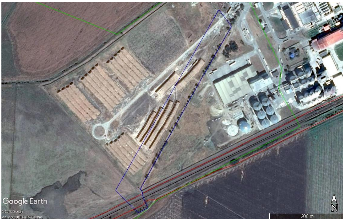
Фигура V.1.9-1: Местообитания на видрата (син контур) според МОСВ (2013) и характер на терена. Червен контур - обхват на Компонент 8; зелен контур - граница на ЗЗ.