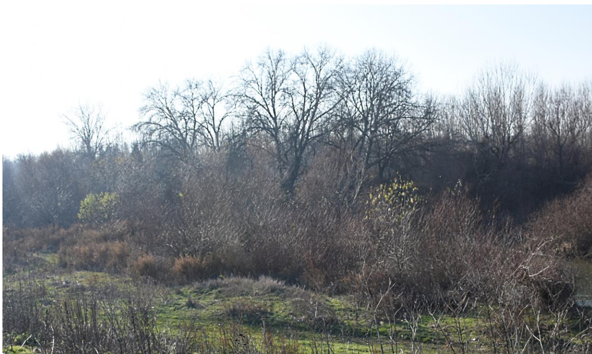
Фигура V.1.8-1: Новоустановен полигон с местообитание 92A0 на десния бряг на р. Тунджа, в обхвата на Компонент 6.

Съгласно данните от проект „Картиране и определяне на природозащитното състояние на природни местообитания и видове - фаза I“ (МОСВ 2013), в обхвата на ИП в границите на зоната липсват полигони от местообитанието. При собственото ни проучване се установи, че в изследвания район попада 1 полигон от местообитанието (Фиг. V.1.8-1).