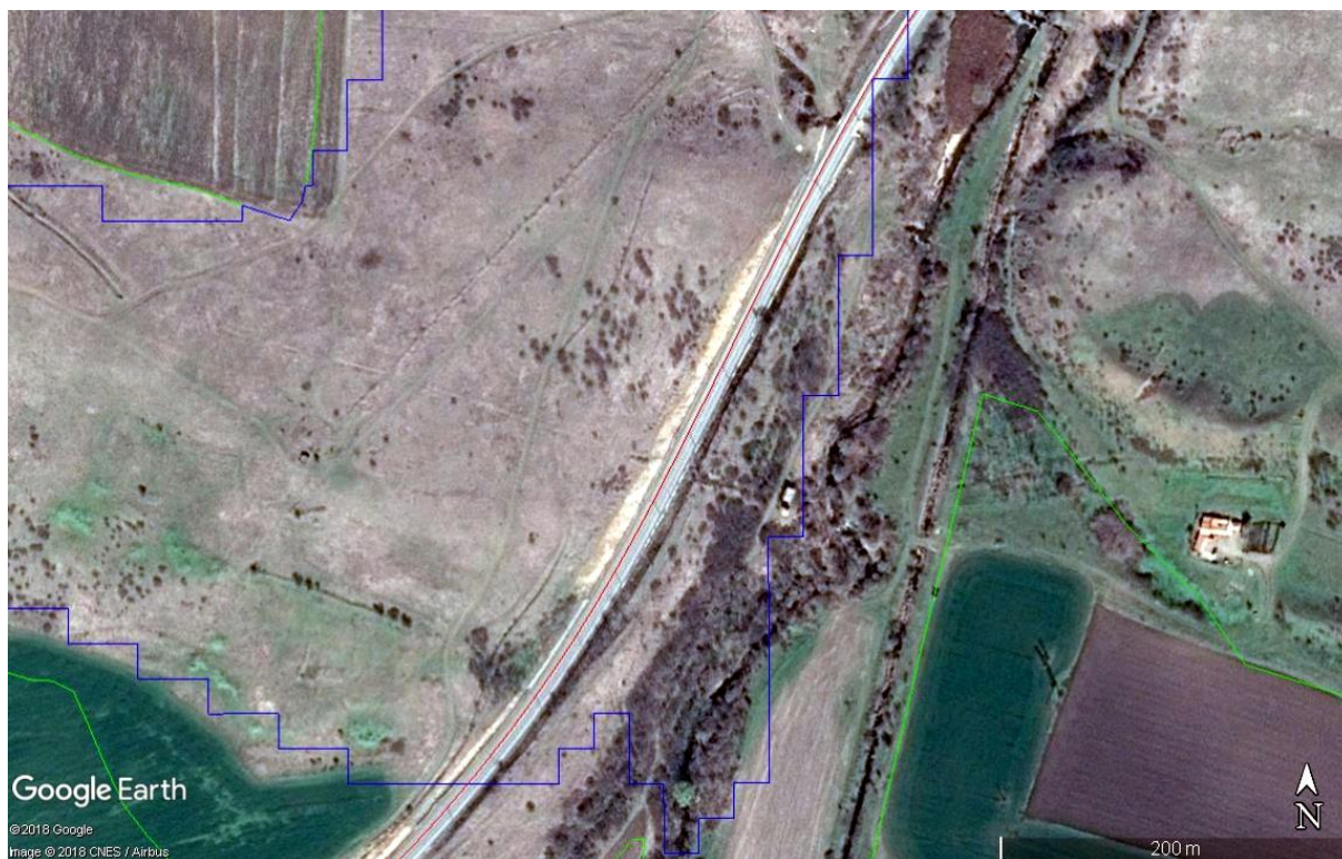
Фигура V.1.10-1: Местообитания на лалугера (син контур) според МОСВ (2013) и характер на терена. Червена линия – ос на жп-линията; зелен контур - граница на 33.

обаче се установи, че очертаения полигон е с много неточни граници, и в него са включени освен ивиците с храсти, част от озеленяването покрай жп-линията, така и самата жп-линия, както и р. Мочурица заедно с прилежащата ѝ дървесна и храстова растителност (Фиг. V.1.10-1, V.1.10-2). Подобни терени са неподходящи за вида. В границите на обхвата на Компонент 1, съвпадащ с обхвата на съществуващата жп-линия, липсват потенциални местообитания на вида.