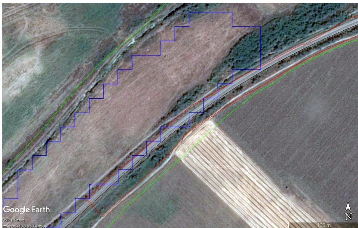
Фигура V.1.9-1: Местообитания на лалугера (син контур) според МОСВ (2013) и характер на терена. Червен контур - обхват на Компонент 8; зелен контур - граница на ЗЗ.

Съгласно данните от проект "Картиране и определяне на природозащитното състояние на природни местообитания и видове - фаза I" (МОСВ 2013), в обхвата на Компонент 8 в границите на зоната попадат потенциални местообитания на вида. При собствените ни проучвания обаче се установи, че очертаната полигон е с много неточни граници, и в него са включени освен ивиците с храсти, част от озеленяването покрай жп-линията, така и на места самата жп-линия (Фиг. V.1.9-1). Подобни терени са неподходящи за вида. В границите на обхвата на Компонент 8 в границите на зоната липсват потенциални местообитания на вида. Такива може да са единствено изоставената отскоро нива в съседство, която отстои на 10 м от ръба на обхвата.