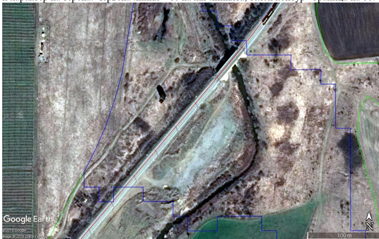
Фигура V.1.10-2: Местообитания на лалугера (син контур) според МОСВ (2013) и характер на терена. Червена линия – ос на жп-линията; зелен контур - граница на 33.