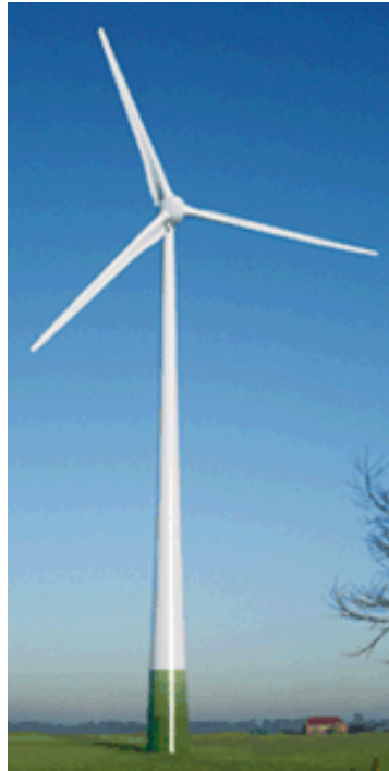
FIG. 2 – Perspectiva de um Aerogerador

A nacelle , instalada no topo da torre, alberga a maior parte dos equipamentos, incluindo os de medição do vento e confere protecção contra a emissão de ruído, etc.