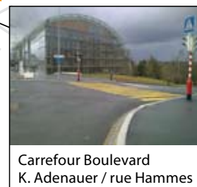
Carrefour Boulevard K. Adenauer / rue Hammes