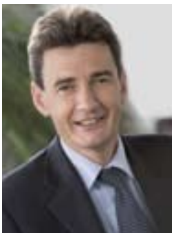
Philippe de Fontaine Vive Vice-Président de la BEI

Les transferts de fonds des migrants vers leurs pays d'origine retiennent, à juste titre, un très grand intérêt : les montants en cause sont, au niveau mondial, tout à fait considérables – 125 millions d'émigrés transfèrent annuellement quelque 300 milliards de dollars à 500 millions de proches dans leur pays d'origine –, et ces flux sont en croissance constante : plus de 130% ces cinq dernières années.