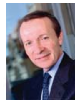
Michel Pébereau Président de la FBE