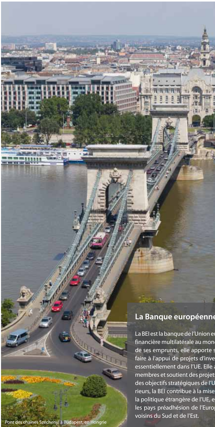
Pont des chaînes Széchenyi à Budapest, en Hongrie