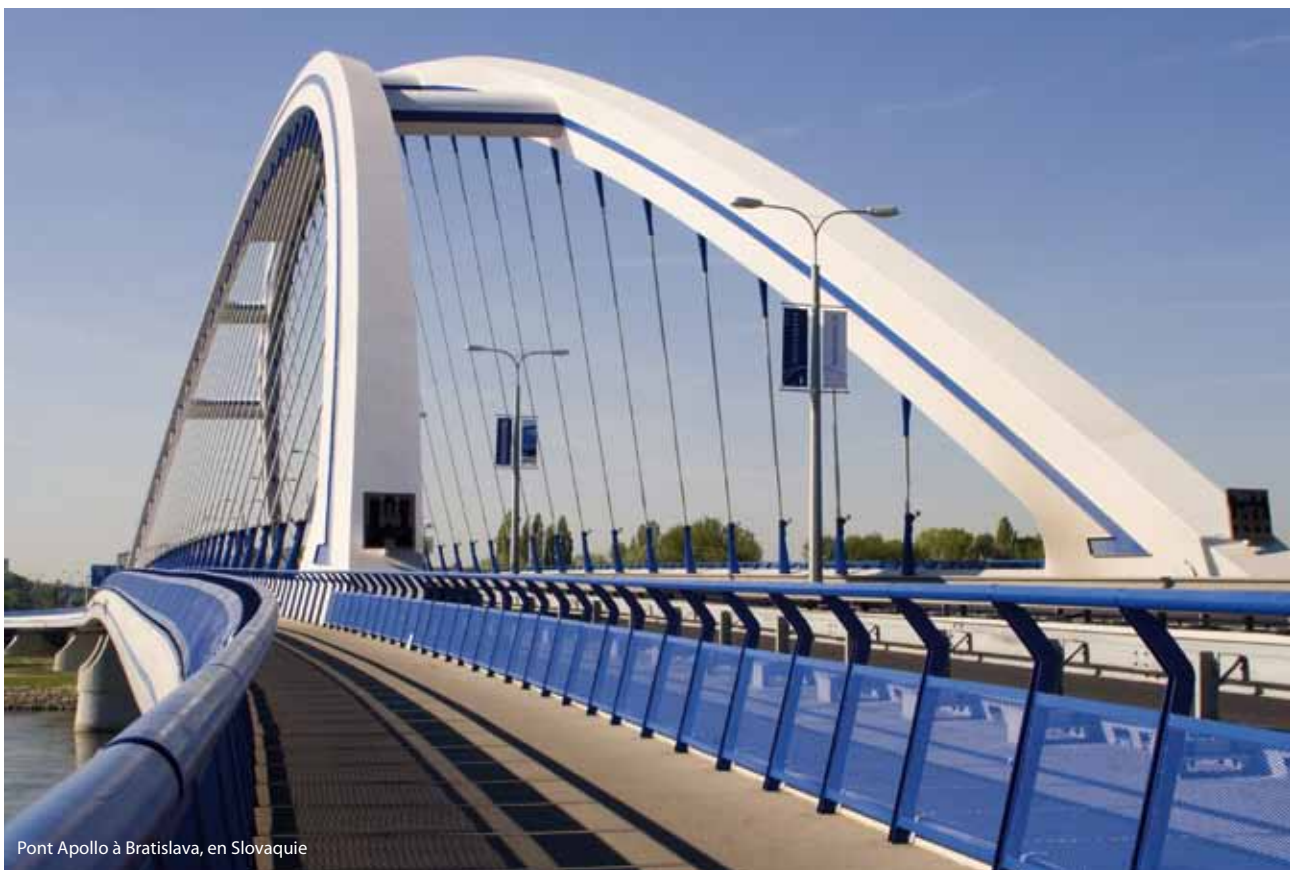
Pont Apollo à Bratislava, en Slovaquie

La région du Danube compte plus de 115 millions d'habitants. Neuf États membres de l'Union européenne 1 et cinq pays non membres de l'UE 2 se partagent le bassin du Danube. La partie de la région située dans l'Union européenne représente un cinquième du territoire de l'UE et l'économie, la compétitivité et le bien-être de la population de cette région sont étroitement liés à la situation qui prévaut dans l'ensemble de l'Union. Pour ces raisons, l'Union européenne a élaboré une stratégie macroéconomique visant à renforcer la coopération transfrontalière dans la région du Danube. La BEI soutient pleinement cette stratégie.