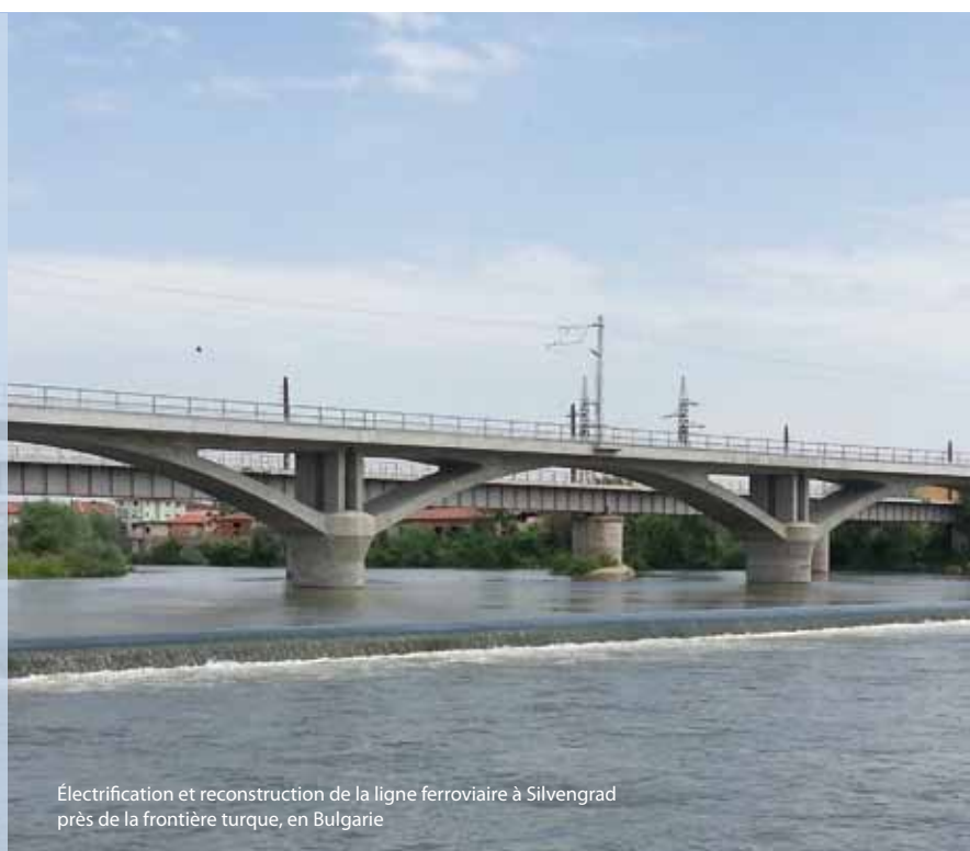
Électrification et reconstruction de la ligne ferroviaire à Silvengrad près de la frontière turque, en Bulgarie