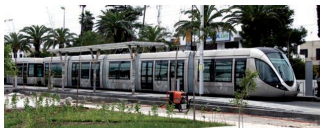
Les transports dans les pays partenaires méditerranéens