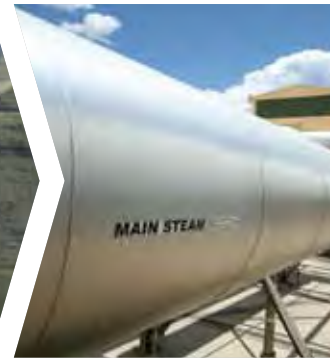
Utilización eficiente de los recursos energéticos de Kenia (1999)