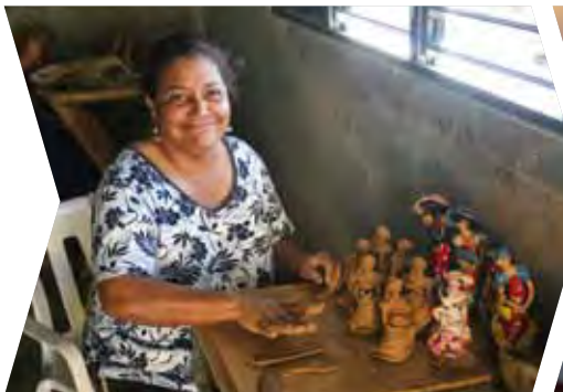
Apoyo a la microfinanciación en la República Dominicana (2008)

Volumen total de la financiación destinada a proyectos de agua potable/saneamiento: 1 500 millones de EUR