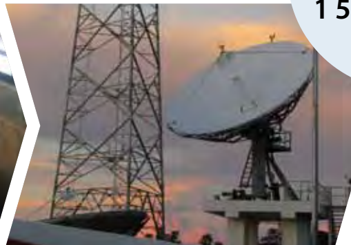
Competencia para redes móviles en el Pacífico (2008)