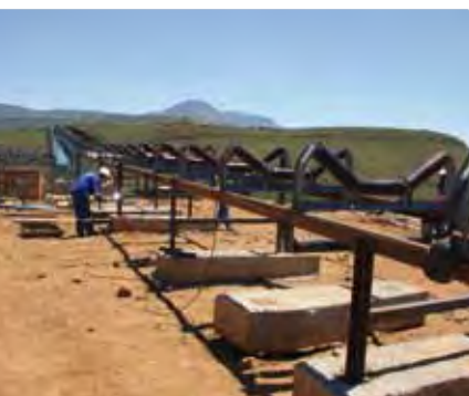
Agua potable y limpia en Lesotho (2010)