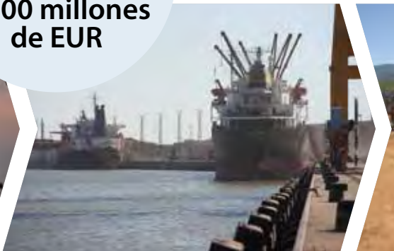
Fomento de la integración regional en Sudáfrica – Corredor de Beira en Mozambique (2009)