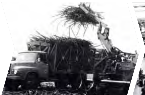
El líder en producción de azúcar en Camerún (1965)