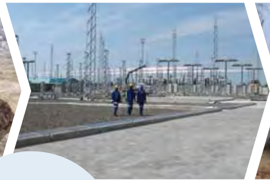
Interconexión de Caprivi en Namibia: un centro de energía eléctrica regional (2005)

Volumen total de la financiación destinada a proyectos de agua potable/saneamiento: 1 500 millones de EUR