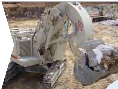
Consolidación del desarrollo económico en Nigeria (2005)