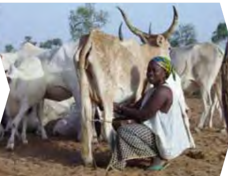
Senegal/I&P Regional - Laiterie du Berger: Mejora de la producción y procesamiento de la leche de los agricultores locales en Senegal (2006)