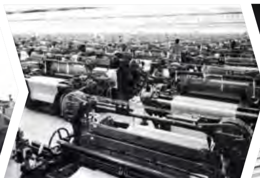
Laminadores de aluminio en Camerún (1965)