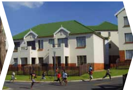
Viviendas sociales asequibles en Sudáfrica (2008)