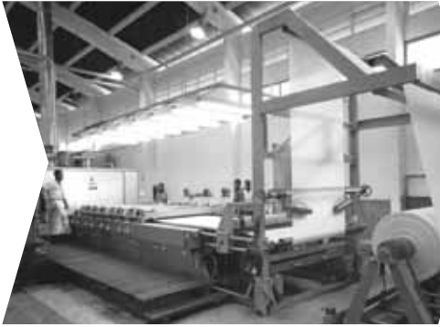
Fabricación textil en Gabón (1968)