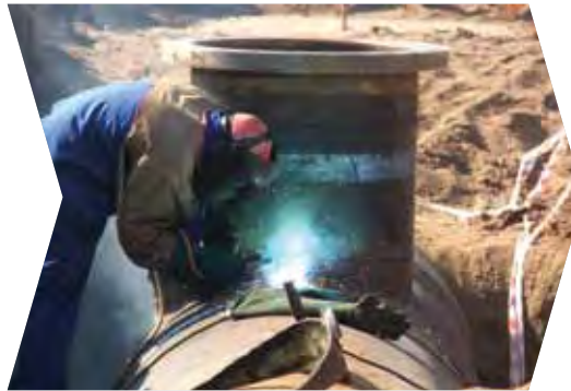
Infraestructuras esenciales para Sudáfrica – Municipio de eThekweni (2012)

Volumen total de la financiación destinada a proyectos de energía: 4 000 millones de EUR