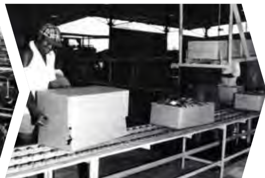
Envasado de plátanos para la exportación en Costa de Marfil (1965)