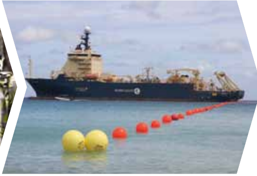
Redes de comunicaciones rápidas y asequibles para las Seychelles (2011)

Volumen total de la financiación destinada a proyectos de energía: 4 000 millones de EUR