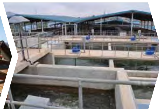
Cobertura de las crecientes necesidades de agua en Uganda (2011)

el marco del Acuerdo de Cotonú (2000-2020) se caracteriza por seguir un enfoque cada vez más selectivo en el objetivo de reducir la pobreza y fomentar el crecimiento sostenible, en particular mediante el desarrollo del sector privado, en consonancia con lo marcado en el Programa para el Cambio de la Comisión Europea y en los Objetivos de Desarrollo del Milenio. El modelo rotatorio y con asunción de riesgos con el que ha sido creado el Fondo de Inversión ACP supone un refuerzo especialmente notable para el apoyo que el BEI presta a las empresas locales y a la inversión extranjera directa. Los 50 años de experiencia del BEI, sus probados conocimientos especializados y su innovadora capacidad de financiación siguen poniendo de manifiesto que constituye una referencia fundamental en la contribución de la UE al desarrollo sostenible de los países ACP.