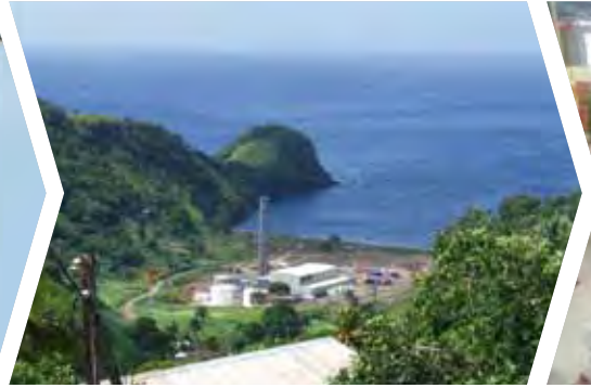
Energía eléctrica en San Vicente y las Granadinas (1984)

La actividad crediticia desarrollada por el BEI en el marco de los distintos Convenios de Yaundé (1964-1975) contribuyó al desarrollo y la modernización de la industria y la fabricación locales, así como de las infraestructuras de transporte, apoyando los acuerdos comerciales preferenciales establecidos en lo relativo a la exportación de productos agrícolas y minerales hacia la CE. Los Convenios de Lomé (1975-2000) suponen el acuerdo de cooperación para el desarrollo de mayor alcance jamás firmado en la historia de las relaciones norte-sur. Además de consolidar los vínculos comerciales entre las regiones ACP y la CE, ampliaron el ámbito de la asistencia financiera para abarcar proyectos orientados a la mejora de las condiciones de vida y el desarrollo económico y social en los Estados ACP, entre los que se incluían proyectos de grandes infraestructuras (en especial para ampliar y mejorar el acceso al abastecimiento sostenible de agua y energía) y de desarrollo del sector financiero. La actividad crediticia que el BEI desarrolla en los Estados ACP en