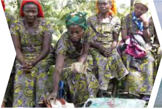
Acceso de los agricultores ecológicos africanos a mercados de comercio justo – Fondo de microfinanciación FEFISOL (2011)