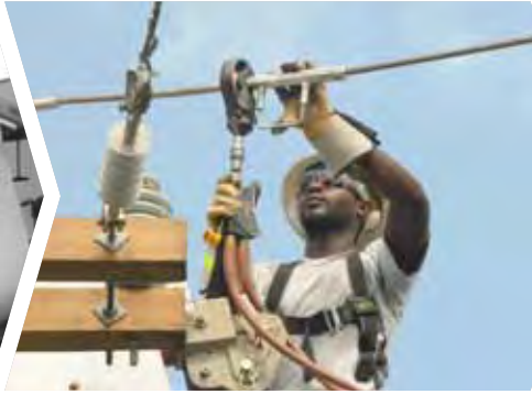
La empresa Barbados Light and Power Company impulsa la energía desde 1980