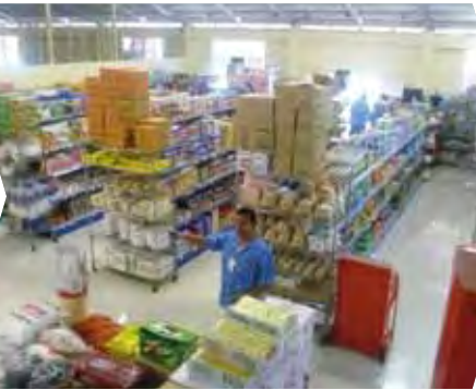
Apoyo a las pequeñas y medianas empresas locales en Samoa (1994)