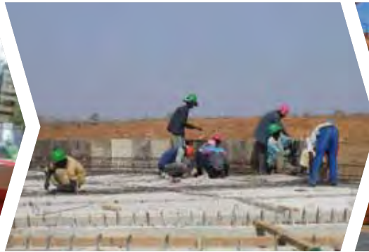
Aumento del suministro de agua potable en Senegal (1995)