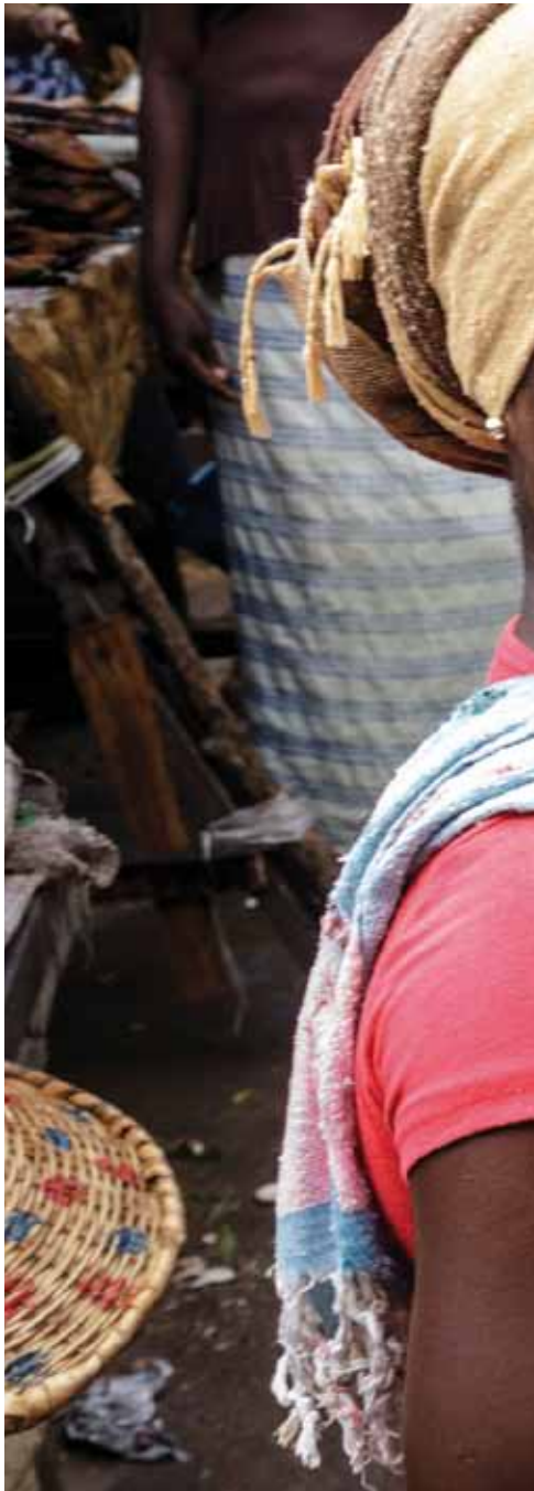
Cifras fundamentales: 1963-31.12.2012, países ACP, PTU y RSA

El BEI desarrolla su actividad en África, el Caribe y el Pacífico (los países ACP) y en los países y territorios de ultramar (PTU) conforme al Acuerdo de Asociación ACP-CE (el “Acuerdo de Cotonú” para 2000-2020) y a la Decisión de Asociación Ultramar (2000-2013), que conforman el marco jurídico de las relaciones de la UE con estas regiones. La financiación canalizada en virtud de estos acuerdos procede del Fondo Europeo de Desarrollo (FED) – cuyos recursos proceden a su vez de las dotaciones presupuestarias de los Estados miembros – y de los recursos propios del BEI, que son captados en los mercados internacionales de capitales. El BEI tiene encomendada la gestión del Fondo de Inversión, un fondo rotatorio que da respuesta a las necesidades de financiación de los proyectos de inversión desarrollados en estas regiones a través de una amplia gama de instrumentos con asunción de riesgos caracterizados por su flexibilidad. Además, con el objetivo de apoyar la preparación y la ejecución de los proyectos que financia, el BEI ofrece a los beneficiarios directos y finales de sus operaciones de financiación ayudas no reembolsables, en forma de bonificaciones sobre los tipos de interés, y asistencia técnica.