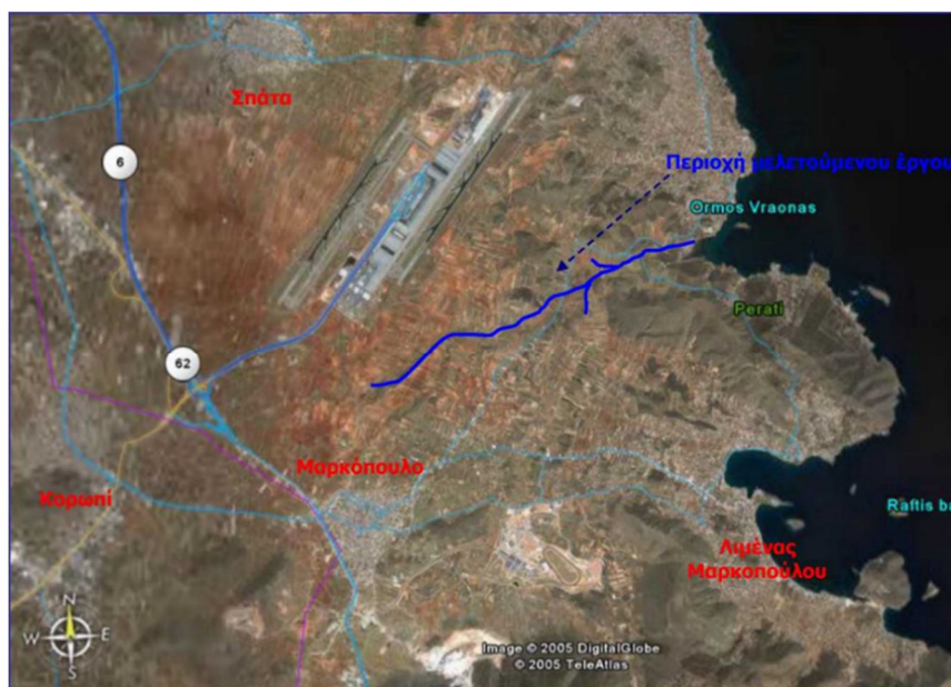
Εικόνα 1: Τοποθεσία υποέργου 4